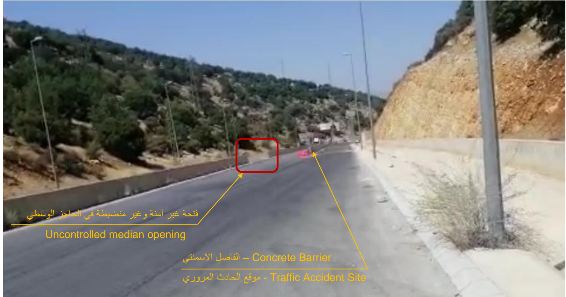
الرسم التوضيحي " 3 " : موقع الحادث المروري و فتحة الطريق في الحاجز الوسطي