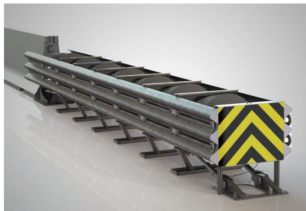
الرسم التوضيحي "4" : ممتصات للصدمات - Crash Cushions & Impact Attenuator