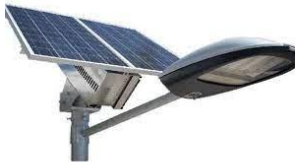
الرسم التوضيحي "6" : أعمدة الإنارة باستخدام الطاقة الشمسية