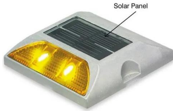
الرسم التوضيحي "5" : عاكسات النور - CAT EYES