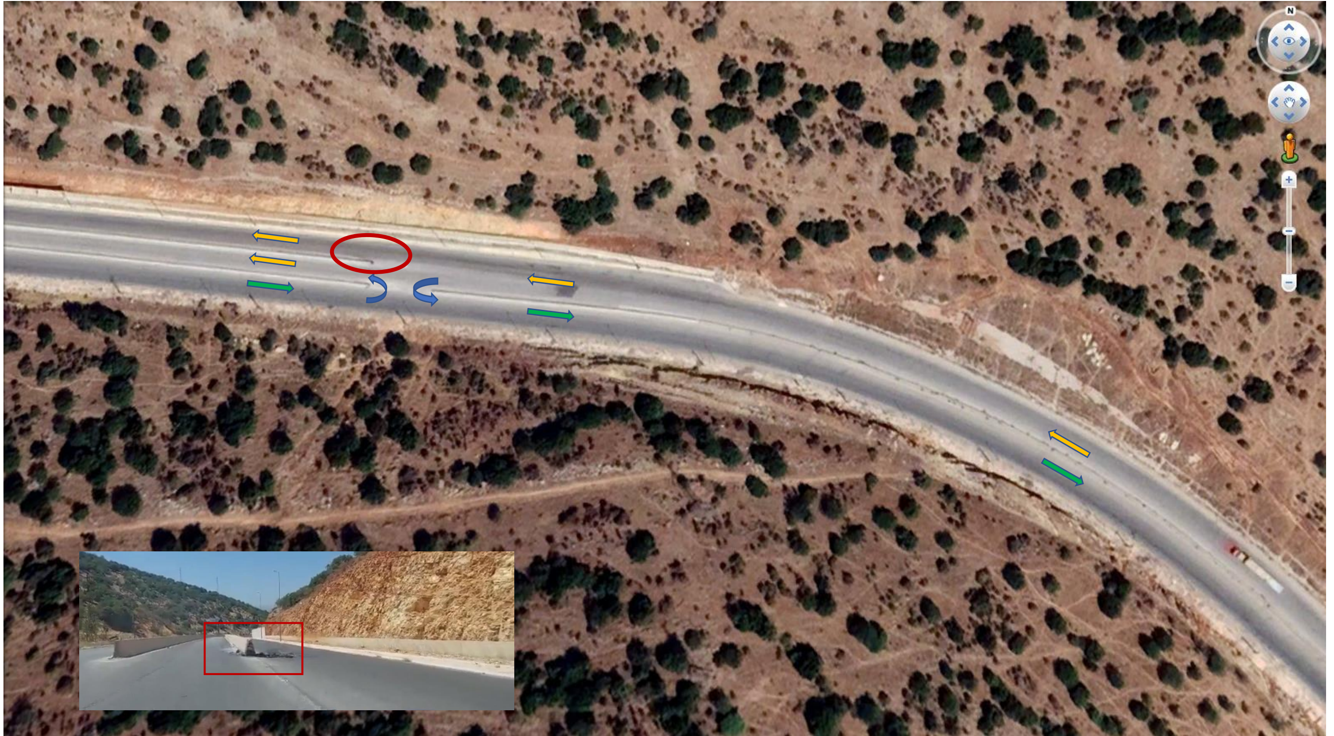
الرسم التوضيحي "2" : الفاصل الاسمنتي - موقع الحادث المروري